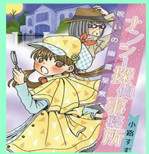
【ナンシー探偵事務所】 小路すず