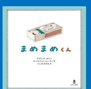
【まめまめくん】 デヴィッド・カリ :文